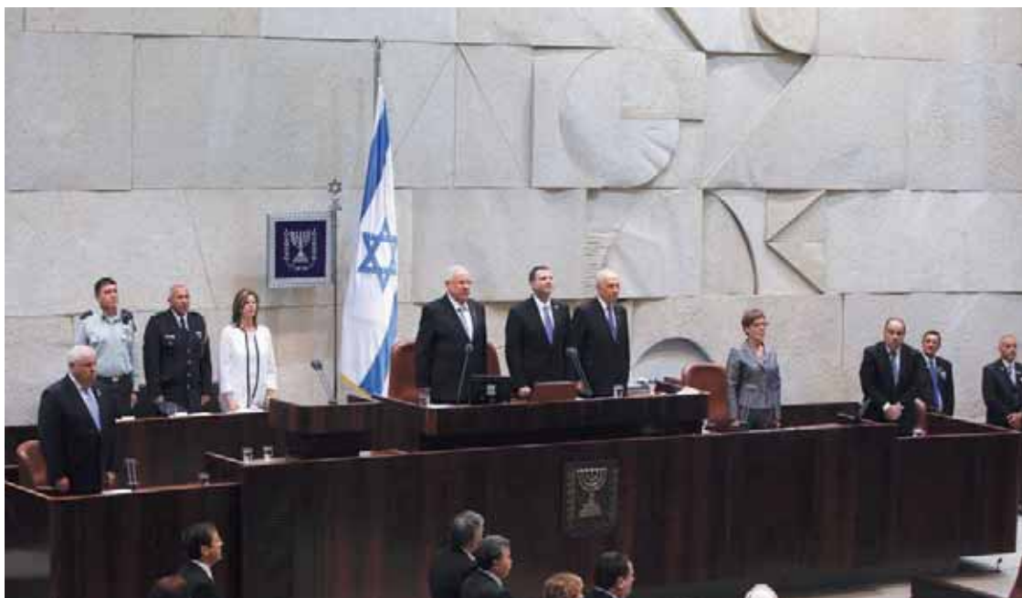
פעילות דלה על רקע מבצע 'צוק איתן'. טקס השבעת הנשיא במתכונת צנועה

ימים ספורים לאחר בחירתו של ריבלין אירע מקרה החטיפה והרצח של שלושת הנערים, ומזן קצר לאחר מכן החל מבצע 'צוק איתן' ברצועת עזה. מרגע החטיפה ועד סיום המושב נמנעה הכנסת מהעלאת הצעות חוק שמוגדרות כשנויות במחלוקת. ההצבעות על לא מעט חוקים נדחו שבוע אחרי שבוע, הצעות אי-האמון הורדו כמעט כליל מסדר יומה של הכנסת, וכך גם הדין שנחשב לשנוא ביותר על ראש ממשלה – דיון 40