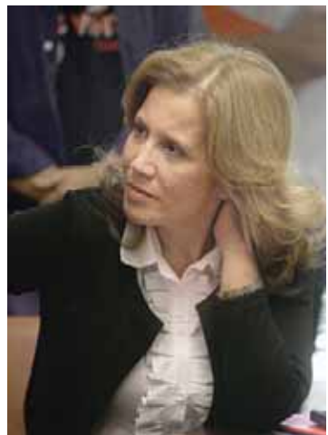
"אמרתי למעסיקים: אלו הנשים, הבנות והאחיות שלכם". לביא

והיקף עבודה גדול. אם תנועות נשים רוצות לקדם את הנשים, בבקשה, תפעלו להעדרה של חברות קטנות, ומי שיהיה הכי טוב יזכה במכרז. האמונה הכי בסיסית שלי היא שאישה שרוצה להתקדם, תעבוד מספיק קשה ותצליח. אני מתנגדת לכך שבשביל שאני כאישה אתקדם, אני צריכה לקבל סיוע של ח"כ עלייה לביא. העזרה הזו מחלישה אותי ומעליבה אותי כאישה. החוקים הללו 'בעד' נשים, הם בעיניי תותבות עבור נשים'. לביא טוענת מנגד כי במצב הקיים, הפערים כל כך גדולים שמדובר בדרך פעולה הכרחית. יש חוקים שצריך לחוקק אותם מראש למספר שנים מסוים, ולבטל אותם ברגע שלא יהיה בהם צורך, כשנראה שיש ייצוג מספק לנשים. גם את החוק הזה אני חושבת להגביל לתקופה של בין שש לשמונה שנים. לאחרונה השתתפתי בכנס נשים גדול של מדינות OECD, והבנתי שהשאלה הזו, האם לחוקק חוקים או לחכות שהזמן והחינוך יעשו את שלהם, מעסיקה גם מדינות אחרות. הנורמה הרווחת בעולם היא לשלב בין הדברים". האם לא עדיף לחוקק חוק מעמד שווה לגברים ונשים במקום להעניק העדפה מתקנת? "גולדה מאיר חוקקה חוק כזה כבר לפני ששים שנה, ב-1954. יש גם חוק שכר שווה לעובד ולעובדת וחוקים נוספים, אבל בפועל לא קורה שום דבר. יש מנגנונים חוקים יותר שמנציחים את המצב הקיים. החוקים שאני מנסה להעביר נועדו לגרום למעסיקים עצמם להבין את הצורך בשינוי המצב. כמו החוק של פרסום נתוני השכר בחברות הממשלתיות, חוק נוסף שקובע שאם אישה גילתה שהיא מרוויחה פחות מגבר בעל ותק וניסיון דומים לשלה, היא תהיה רשאית לתבוע את המעסיק לא רק בגין נזק ממוני אלא גם על עוגמת נפש, על הפגיעה בביטחון העצמי ועל כך שלא יצאה להכשרות מקצועיות". ■