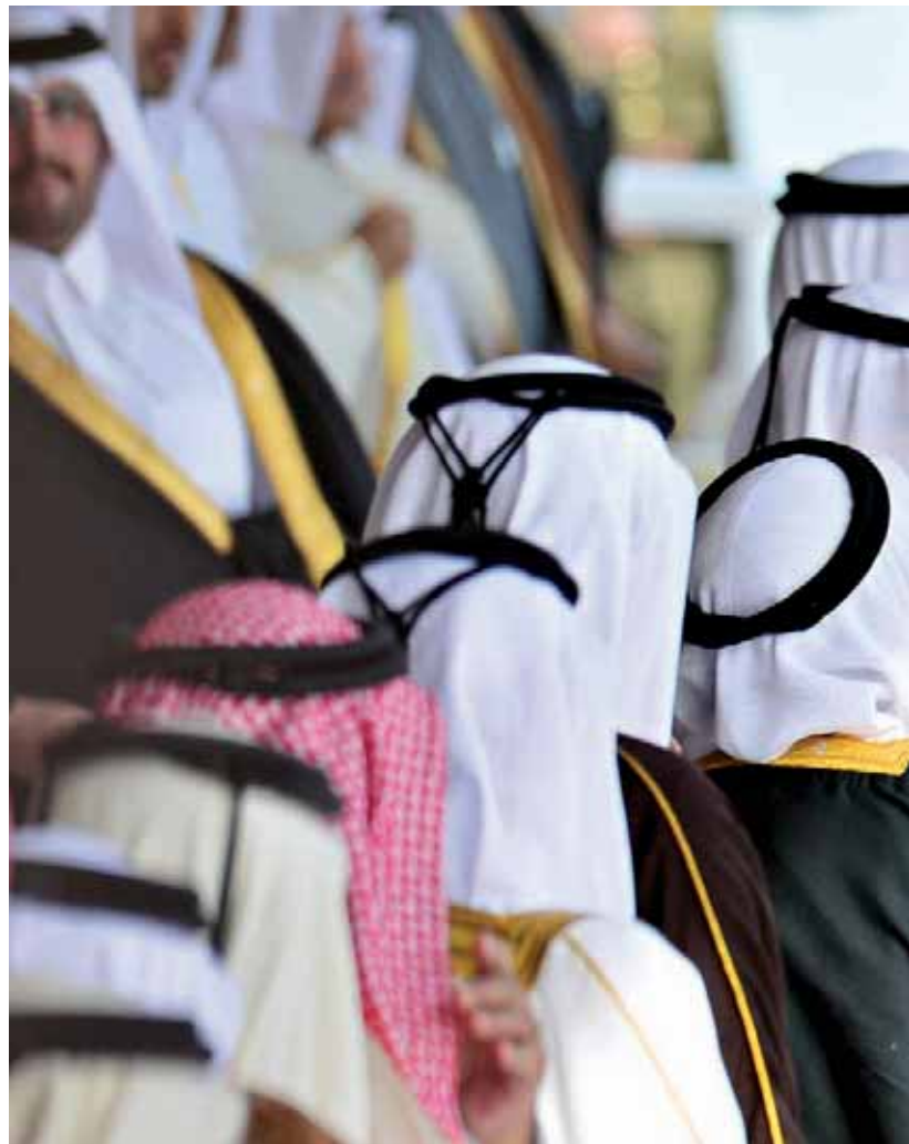
האיש העשיר בעולם ותומך חמאס נלהב. שליט קטאר, תמים איתאני צילום: EPA

קוריאה. תביעה ישירה נגד קטאר היא בעייתית, שכן למדינות ולבעלי התפקידים בהן מוענקת חסינות ריבונית, שלא מאפשרת הגשת תביעה ישירה. בארה"ב ישנו הריג האומר שמדינות תומכות טרור ניתנות לתביעה, אך המדינות הללו צריכות להיות מוכרות על ידי משרד החוץ האמריקני. מדובר כמוכר בהכרזה פוליטית, וכרגע הרשימה כוללת את איראן, סוריה, סודן ואלג'יריה".