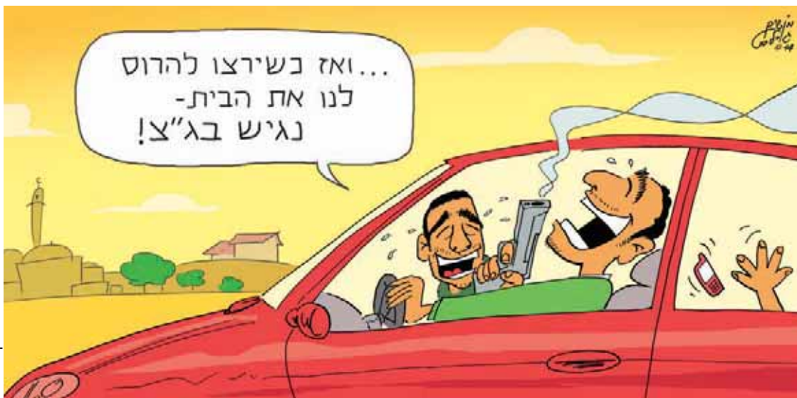
איור: חושיק גולדסט

וכאן הגענו לנקודה: המדינה כותבת כמעט במפורש שהעתירה מאלצת אותה לחשוף מידע ביטחוני שהיא הייתה מעדיפה לשמור באופן חשאי. כדי לקבל את הסכמת בג"ץ לצעד הכליך אלמנטרי של הריסת בתיהם של מחבלים שפלים שחטפו ורצחו שלושה נערים, נאלצת המדינה לחשוף מידע רגיש ולגלות כמעט כל מה שידוע לה על התכנון והרצח, ואת בשעה שהמחבלים טרם נלכדו, והמידע המפורסם בריש גלי עלול לסייע להם לתיאום ערויות או להשמדת ראיות. או אמנם בשביל לשמור על משהו מהקלפים שבירו שירות הביטחון מגלה רק 90 אחוזים ממה שידוע לו ולא 100 אחוזים.