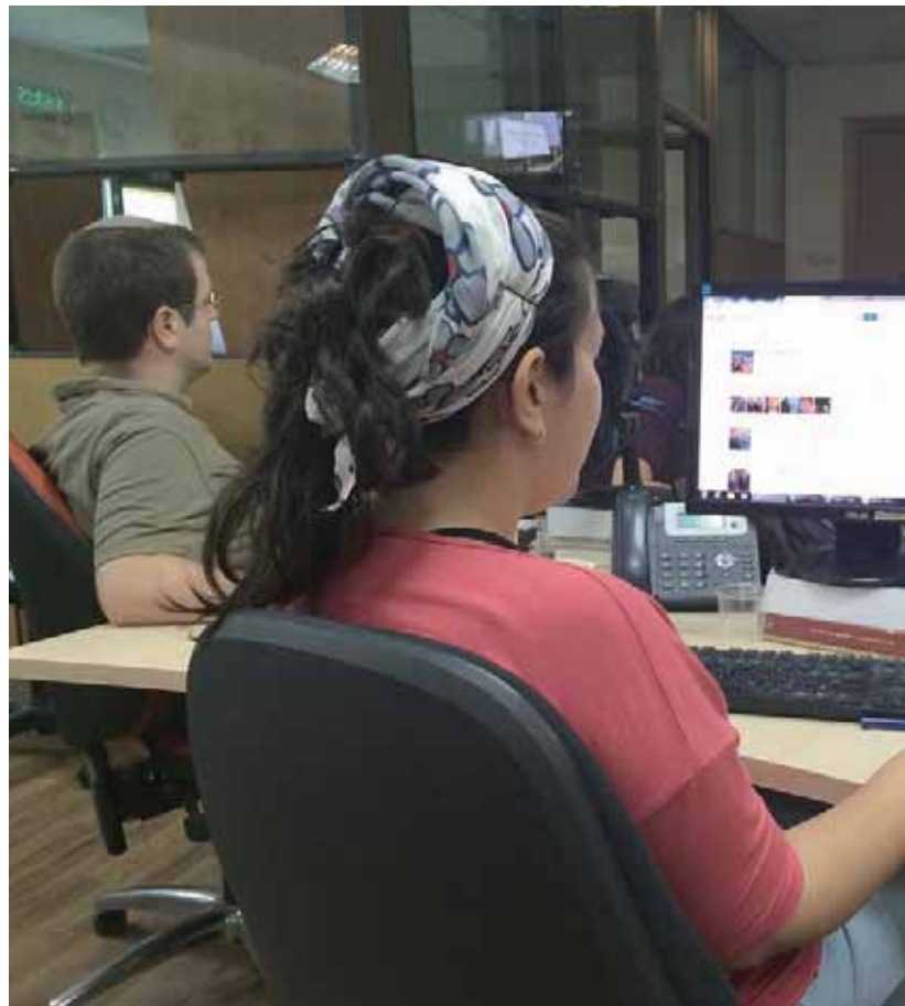
עובדת שמרוויחה פחות מעמיתיה הגברים תוכל לתבוע פיצוי כפול. אילוסטרציה

אין ענייננו כאן לשאול מניין הגיעה תפיסה זו, אלא האם היא נכונה. התשובה לכך שלילית. מוסר מלחמה מתוקן הוא הפוך בדיוק: יש לדאוג לקרוב לפני הרחוק, לצד 'שלנו' לפני הצד 'שלהם'. מלחמה מעצם טבעה מתנהלת בין שתי קבוצות, לא בין שני פרטים. כל צד מחויב לשלום אנשיו לפני שהוא מחויב לשלום אנשי הקבוצה היריבה. המדרג הנכון צריך להיות כזה: על כל צד לדאוג, לפני הכול, לשלום אזרחיו הנמצאים בעורף; לאחר מכן עליו לדאוג