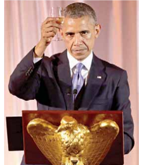
קרא למתנגדיו "להפסיק לכעוס ולשנוא". אובמה בכינוס ראשי מדינות אפריקה בושינגטון, השבוע

הרוב הרפובליקני בקונגרס אישר הגשת תביעה נגד אובמה בטענה שחרג מסמכותו. הנשיא כינה את הצעד "תעלול פוליטי"