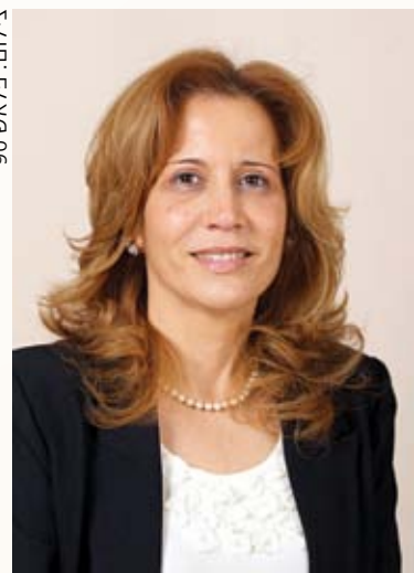
”הכרעה פוליטית בסוגיה דתית” ח”כ עליזה לביא