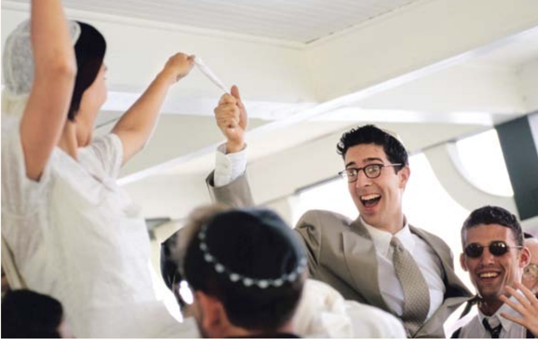
הרי את מקודשת לי, אולי. אילוסטרציה